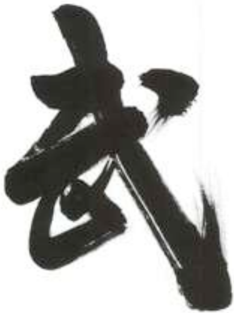
wu - les arts martiaux

Par la Voie, habiter la pratique Par la pratique, entrer dans la Voie