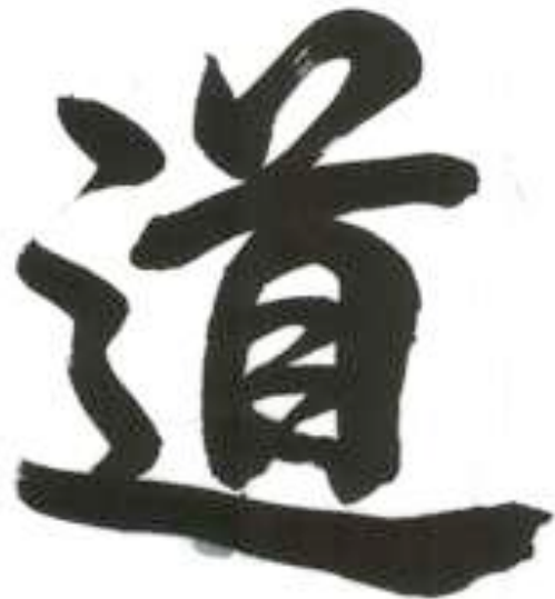
dao - la Voie