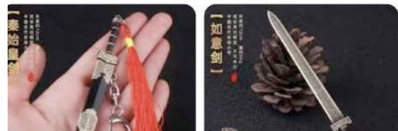
épée ancienne de petite taille